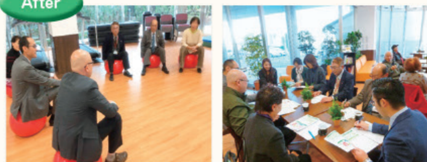
現在の協議体の様子

【協議体を情報発信の場に】 協議体で話題にのぼった事を、協議体メンバーから各団体へ、さらに地域住民へ情報発信しています。各組織の活発化や組織間の連携につながっています。