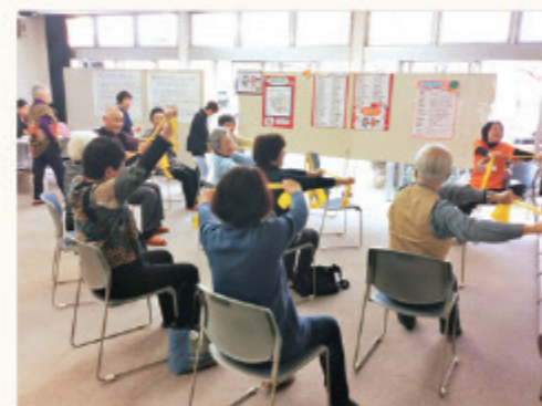
ふじみパワーアップ体操体験