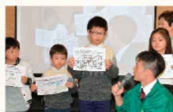
受賞者の子ども達、市長と協議体コアメンバー

取り組みプロセスをコアメンバーで共有できたことで絆が深まり、自分事と感じてくれるように、各所属団体等で自発的に新たな啓発を進めてくれています。