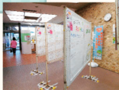
デザインコンテストと合わせてフォーラムもPR