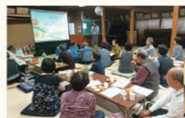
サロンでの出前講座