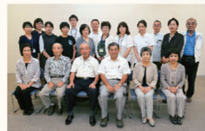
ささえ愛ながとろのメンバー

地縁関係者の声を反映することのできる協議体となっておらず、再編成を検討。そこで、まずは大づかみ方式による勉強会を開催、地域づくりや協議体の目的を勉強しました。町の現状だけでなく、地域に残っているつながりが大切なことも伝えました。