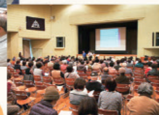
みやしろ大学でのちよこつと出前講座