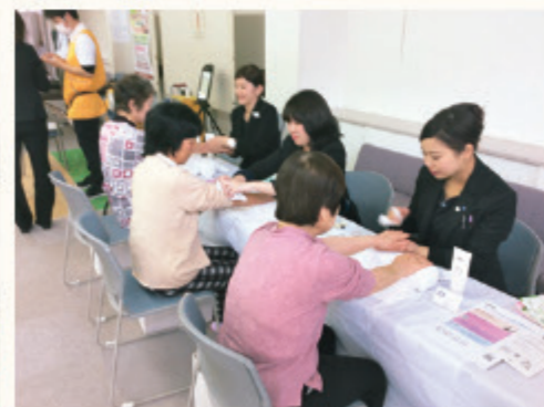
ハンドマッサージ体験

鈴山SC：外出しづらくなってしまった人でも、イキイキと暮らすヒントになればと思いました。訪問理美容でキレイになったら、外出意欲も上がるかも？