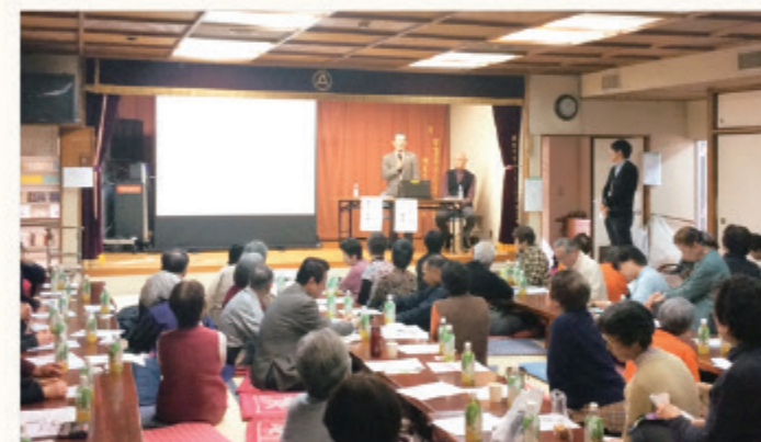
活動者発表&利用者発表

【活動者発表&利用者発表】 利用者の方の「病気や障害を抱えても自分の住み慣れたまちで暮らしていきたい」という声に、会場からもたくさんの共感がありました。