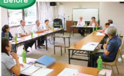
第1回協議体の様子

初回の協議体で協議体会長の「ざっくばらんに話し合しましょう」の一言がきっかけで、机の配置を口の字から近づけた配置に。 その後、出張型協議体や近況報告を行うことに・・・