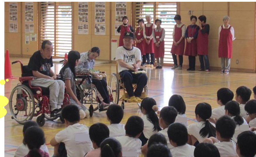
↑ 障害者施設の利用者がご自身の話をしている様子